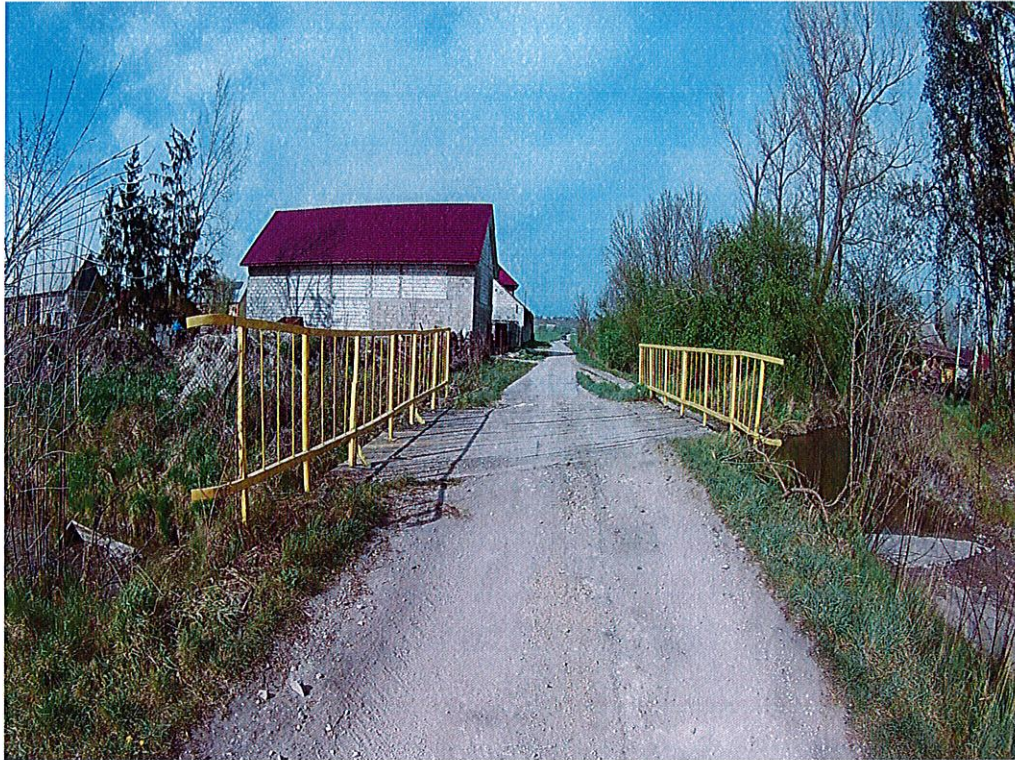
Fot. 1. Widok ogólny na most i na nawierzchnię jezdni