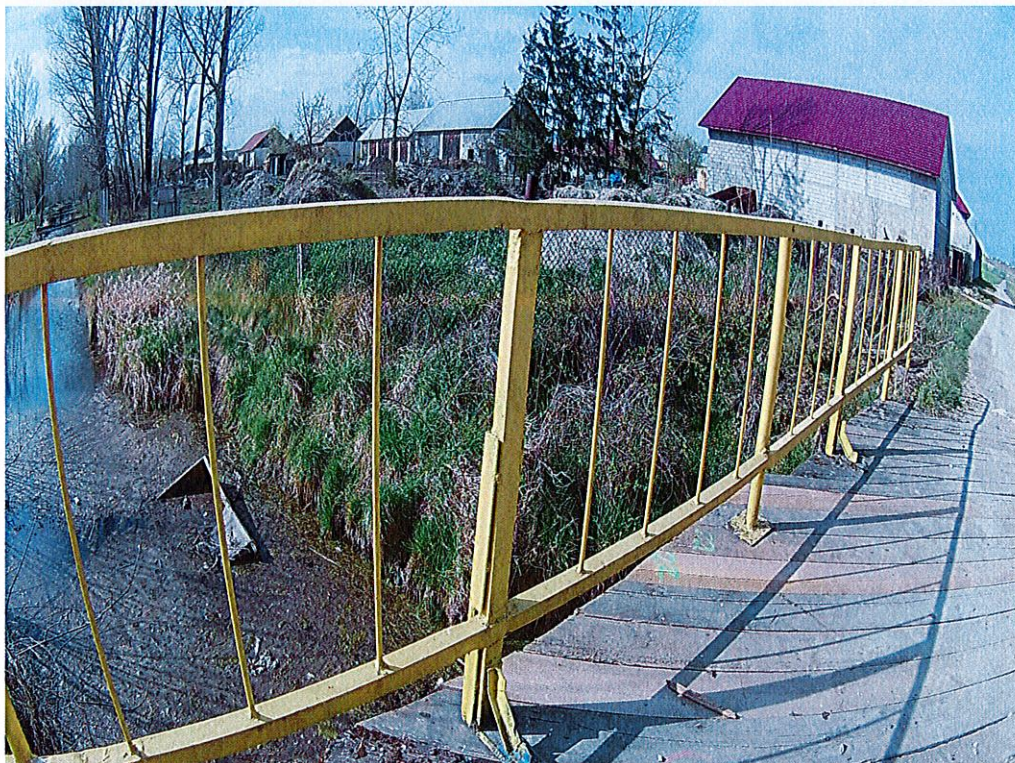
Fot. 2. Widok na barierę dla pieszych