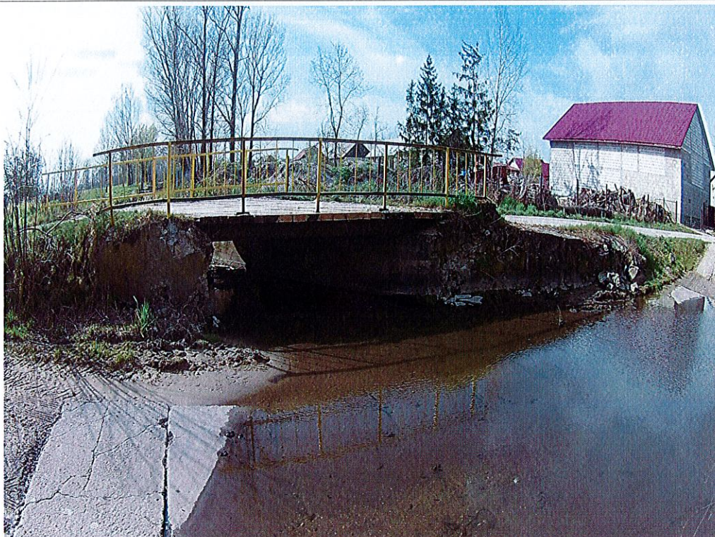
Fot. 3. Widok boczny na obiekt