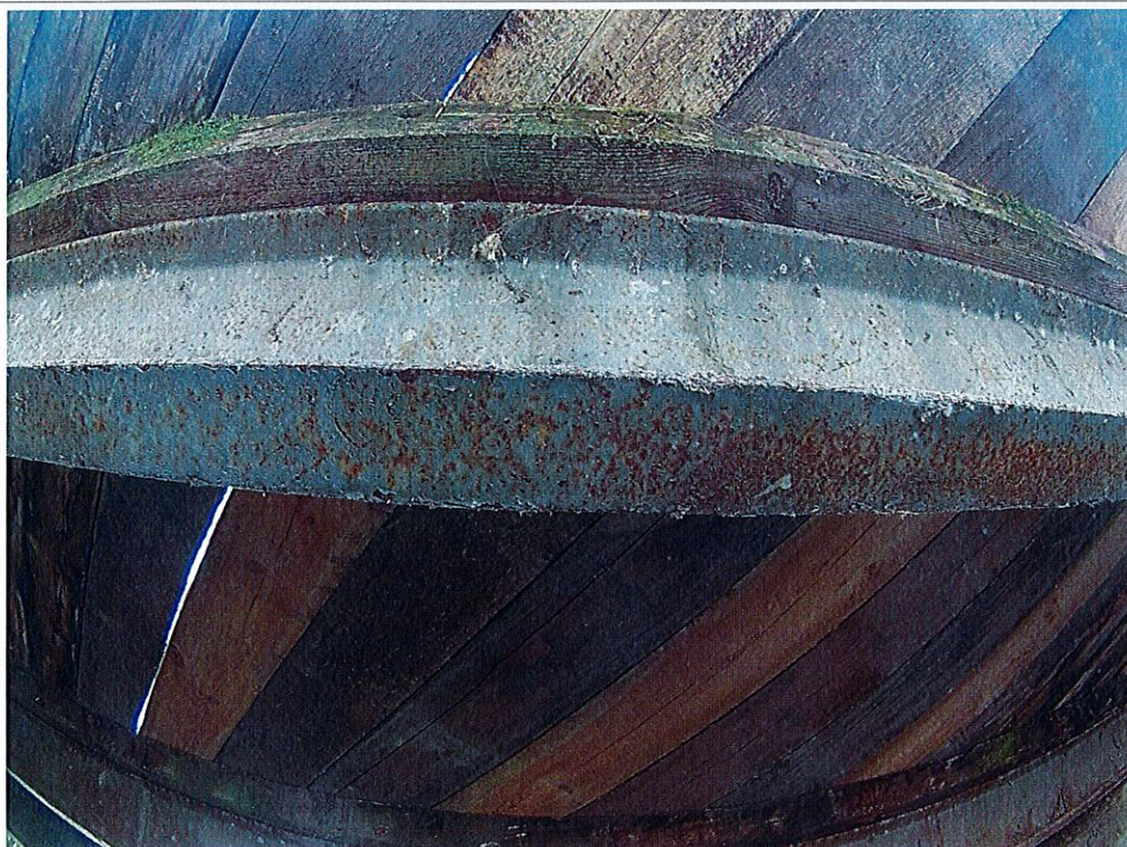
Fot. 3. Korozja jednego z dźwigarów