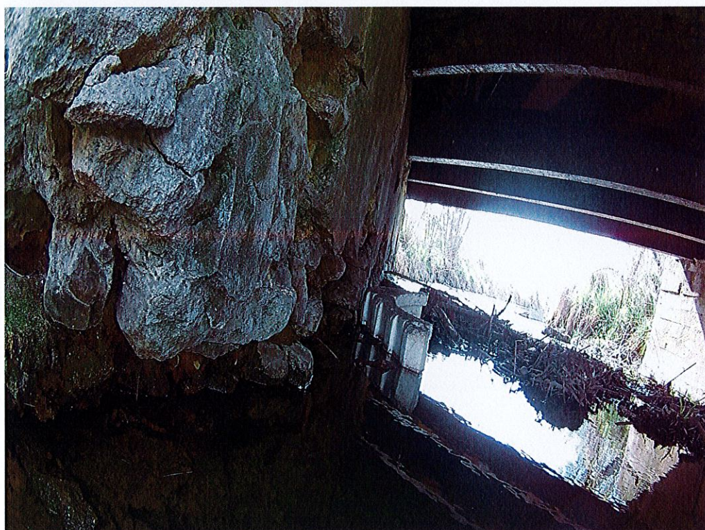
Fot. 4. Ubytki betonu w jednej z ścian przyczółka