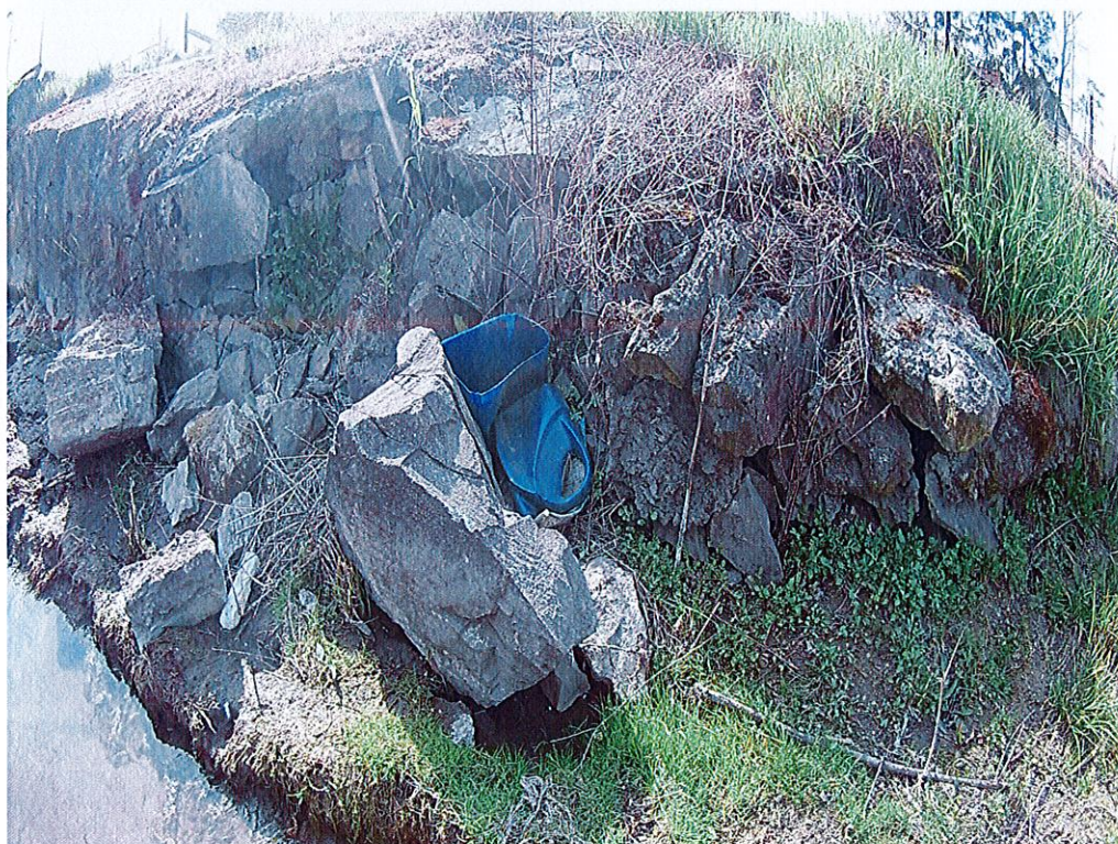
Fot. 2. Znaczne ubytki w konstrukcji oporowej