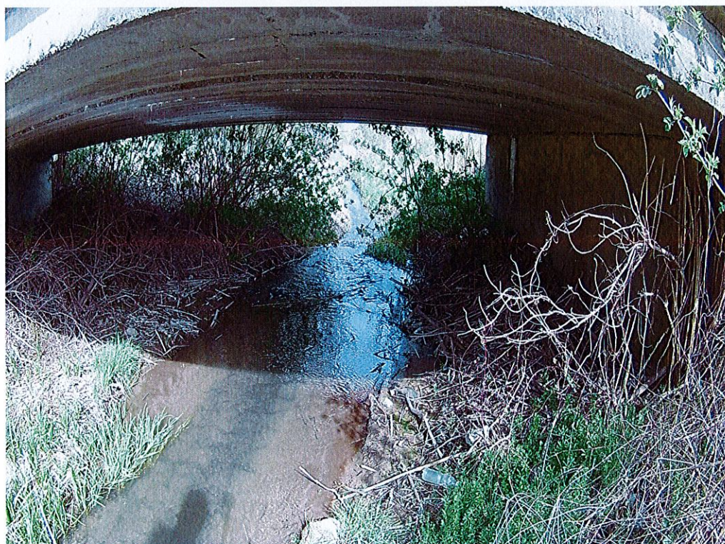
Fot. 4. Widok na most z perspektywy dolnej