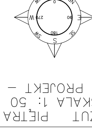
RZUT PIĘTRA SKALA 1:50 - PROJEKT -